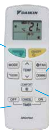
Afstandsbediening voor FTXB20-35C

Hiermee kunt u het toestel programmeren, inclusief de aan/uit- en nachtmodus*. *1 uur na activering van de nachtmodus wordt de instelwaarde verhoogd bij koelen of verlaagd bij verwarmen om comfortabele slaapomstandigheden te garanderen